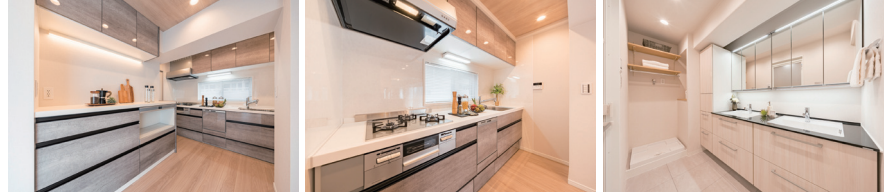
※家具・インテリアは展示用になります。