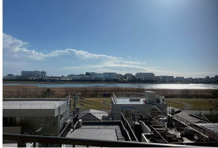
バルコニーから多摩川が望めます